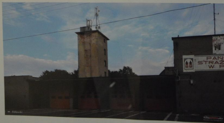
Siedziba Państwowej Straży Pożarnej w Płońsku przy ulicy Leona Rutkowskiego, fot. Rok 2011