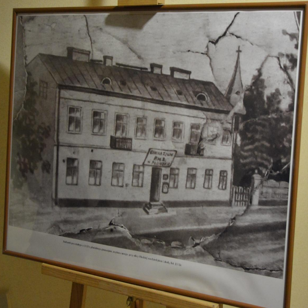
Widok powstały w 1917 z powodu powstania, wybuchu węgla przy ulicy Kłokiej na dziedzińcu szkoły, fot. 1917r.