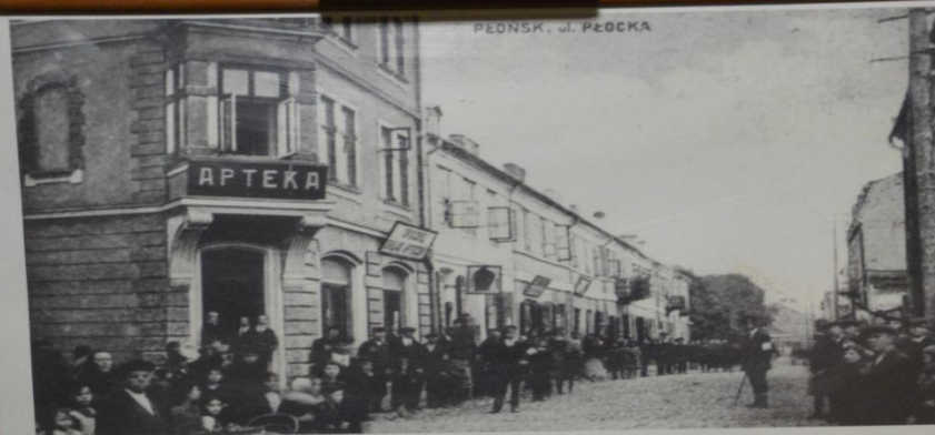
Ulica Płocka w Płonisku (widok od strony rynku) Fot. Z lat 1914-1918