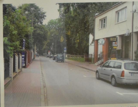
Ulica Leona Rutkowskiego w Płocku