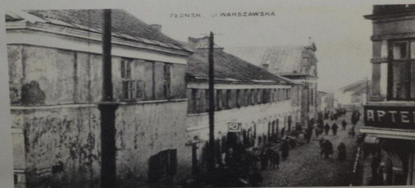
Ulica Warszawska w Płonisku (widok od strony rynku). Z lewej strony widoczny dom, w którym przed wyjazdem z Płoniska w 1906 roku mieszkał Dawid Ben Gurion, oraz synagoga.