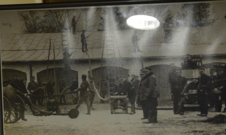
Członkowie Ochotniczej Straży Pożarnej w Płońsku przed remizą strażacką przy Placu im. Tadeusza Kościuszki (obecnie teren parku im. Konstytucji 3 maja).